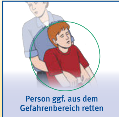
Person ggf. aus dem Gefahrenbereich retten